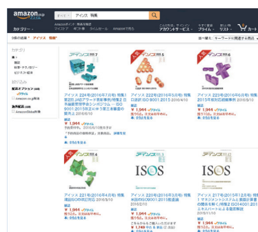
amazonでのアイソス販売画面

雑誌販売の100%が通信販売(一部売りも実施)・年間購読料は一括前払い制。販売は年間購読及びデジタル版の販売は富士山マガジンサービスに委託(販売管理及び雑誌発送管理等、全面委託)、単品販売はアマゾンに委託。いずれも、ウェブ上のサイトで販売しています。